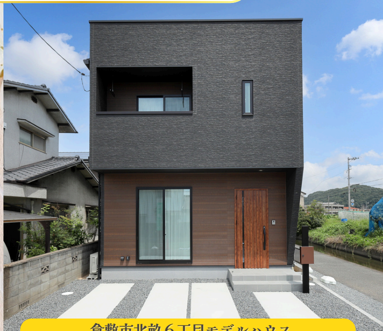
倉敷市北畝6丁目モデルハウス