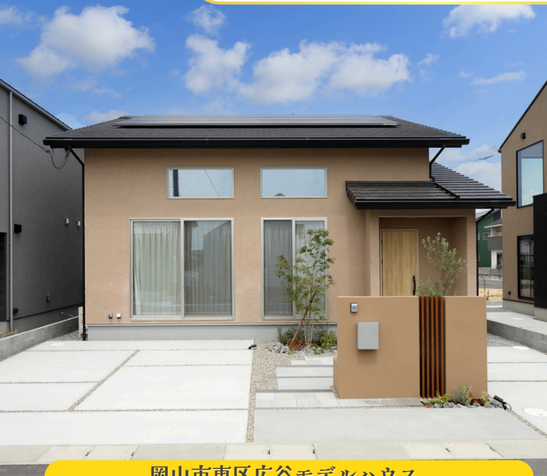
岡山市東区広谷モデルハウス