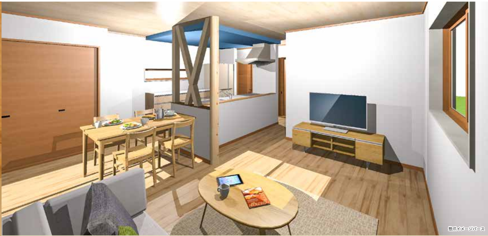
惣爪イメージバス