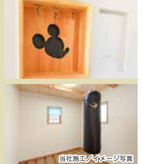
当社施工/イメージ写真