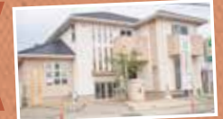
ナビ住所 岡山市南区泉田2-5-16

断熱性の良さと設計の工夫で、年中エアコン1台で運営する泉田モデルハウス。スキップフロアや土間収納、小屋裏を利用したロフトなど空間を最大限に使い、ALL自然素材仕上げで、ゆったりと上質な暮らしを提供する遊び心のある5層の家。宿泊体験も行っていますので、是非ご利用下さい。