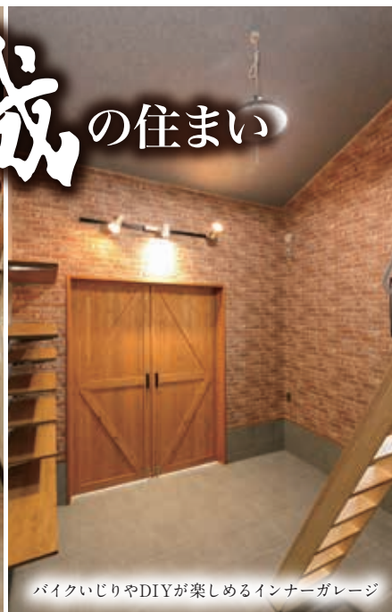
バイクいじりやDIYが楽しめるインナーガレージ