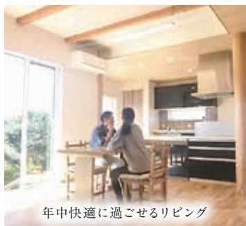
年中快適に過ごせるリビング