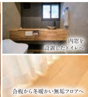
内窓を設置したトイレへ