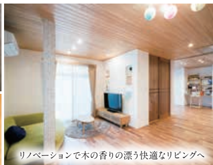
リノベーションで木の香りの漂う快適なリビングへ

不動産から始まり、創業から37年、新築をはじめ、小さな工事から増改築など大規模なリフォームまで、ご要望に応じて各種リフォーム工事を行っております。家族が健康で快適に暮らせる家づくりを追求し、地震に強くさらに安全で安心、そして、こだわりいっぱいの家づくりに一丸となって取り組んでいます。