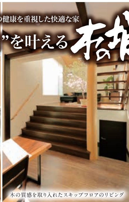
木の質感を取り入れたスキップフロアのリビング