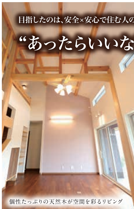
個性たっぷりの天然木が空間を彩るリビング