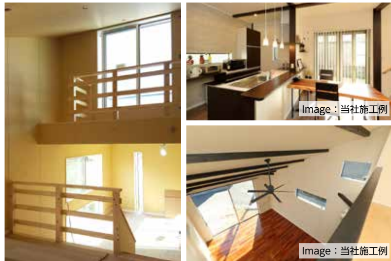
Image : 当社施工例