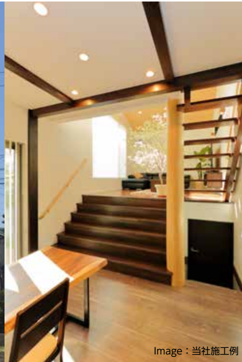
Image : 当社施工例